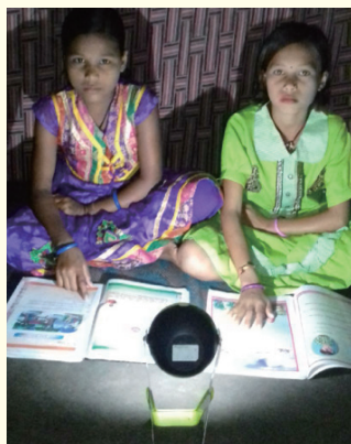
Students in India using solar lighting to prepare for final examinations

The result of this research project is included in my Global Issues courses at Kyoritsu Women's University. Students learn first-hand how a leading Japanese company can play a positive role in improving the lives of children living in poverty, and also how individual citizens can take