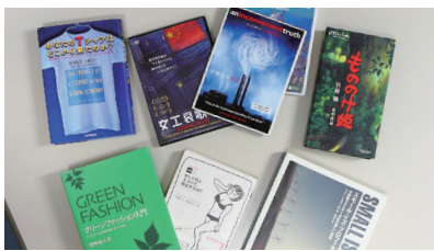
学生が親しみやすいDVD、テキスト

生活デザイン論・プロダクトデザイン論・生活プロダクトデザイン演習・ファッションデザイン論・デザインの現在・色彩学・身体メディア実習 ほか