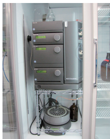
生体成分精製装置

生物学、基礎生物学、分子生物学、生化学、生物学実験、生化学実験、食生活素材論、食品学特論、食品学演習、ほか