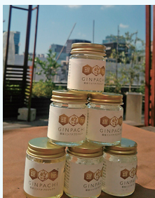
銀座でつくられたハチミツ

共立アカデミーで銀座ミツバチプロジェクトに出会い、参加させていただいたことで多くのことを学びました。特に何事にもチャレンジすること、あきらめないで継続することは今後の人生の目標です。大変貴重な体験をさせていただいたことを大変うれしく思います。機会があればミツバチプロジェクトに参加させていただきたいと思っています。