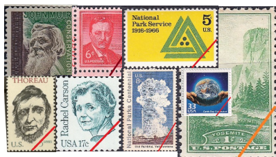
アメリカの環境関連記念切手

主な担当科目 アメリカ文化論Ⅰ、地球環境論、政治分析の基礎、環境・科学の諸課題ほか