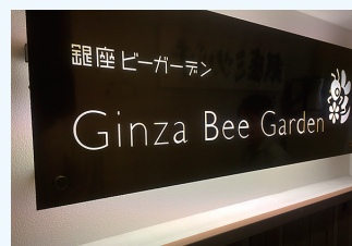
テラスの入り口にあった看板